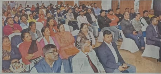
दैनिक जागरण और यूटीआई म्यूचुअल फंड द्वारा धनबाद क्लब में आयोजित निवेशक जागरूकता कार्यक्रम में अतिथि